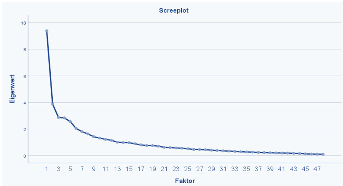
Abb. 3: Scree-Plot für die Hauptkomponentenanalyse mit dem Extraktionskriterium Eigenwert > 1